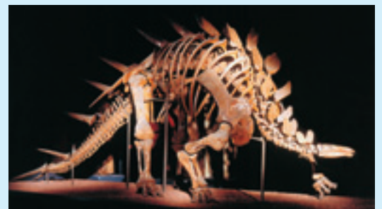
Kentrosaurus (Buddensieg, Museum für Naturkunde)

Brachiosaurus (Hennings, Museum für Naturkunde) len auf der Nordhalbkugel vollständig, während Titanosaurier wie Janenschia ansonsten nur noch in China gefunden wurden. Der Stegosaurier Kentrosaurus ist ebenfalls näher mit chinesischen Formen verwandt als mit dem nordamerikanischen Stegosaurus . Auch die am Tendaguru gefundenen Raubsaurier sind wahrscheinlich frühe Vertreter von rein auf die Südkontinente beschränkten Gruppen, den Abelisauriern ( Elaphrosaurus ) und den Carcharodontosauriern. Letztere