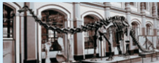
Diplodocus (Museum für Naturkunde)

Zur Zeit des Oberen Jura hatten sich die Sauropoden in zwei Hauptlinien aufgespalten, die als Diplodocoidea und Macronaria bezeichnet werden. Zu ersteren gehören die schlanker gebauten Formen mit stark verlängerten Schwänzen wie Dicraeosaurus und Diplodocus , während die zweite Gruppe am Tendaguru durch die riesenhaften Formen Brachiosaurus und Janenschia repräsentiert ist. Der in der Ausstellung