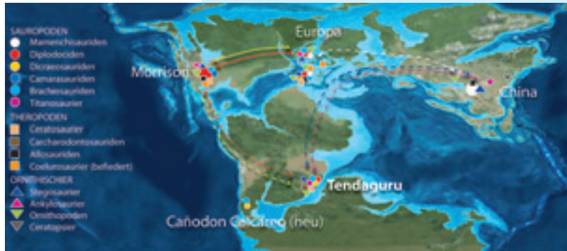
Abb. 5 Bedeutung der Tendaguru-Sammlung für das Verständnis der Ausbreitungsgeschichte der Dinosaurier. Dargestellt werden bislang bekannte Dinosaurierlagerstätten aus dem Oberen Jura (vor 150 Millionen Jahren) und die Zusammensetzung ihrer Faunen. Gestrichelte Linien zeigen einen Austausch von Faunenelementen an, der deutlich vor dem Beginn des Oberjura stattgefunden haben muss. Dinosaurier unterteilen sich in zwei Hauptgruppen, die pflanzenfressenden Ornithischier und die Saurischier, die die Sauropoden und die räuberischen Theropoden umfassen. Aus letzteren gingen spätestens im Oberjura die Vögel hervor. (Kartengrundlage: Ron Blakey)